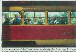
Un tram. Maurice Schobinger s'est attaché à signifier le passage du temps.