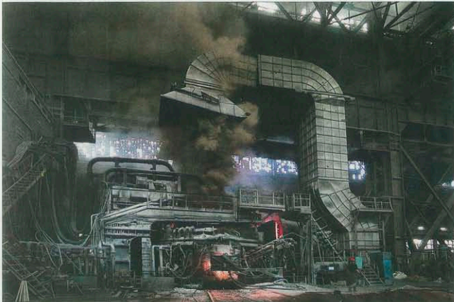
La fonderie Octobre rouge. L'usine de cinq kilomètres de longueur fournissait à l'époque l'armée rouge en matériel de guerre avant d'être aplatie par les bombes, puis reconstruite. Elle est toujours en activité. AGENCE

Le témoignage personnel d'un photographe vaudois dans l'ancienne ville martyre