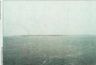
La Volga. Le fleuve a joué un rôle stratégique pendant le siège de Stalingrad. AGENCE